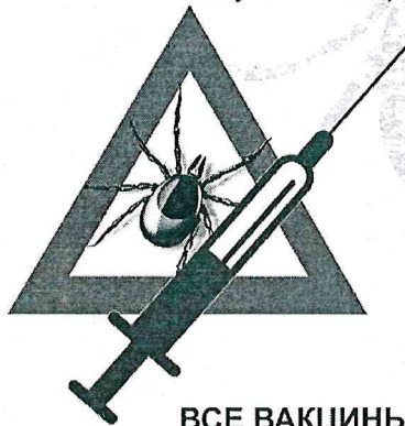
Схема вакцинации против клещевого энцефалита состоит из 3-х доз, которые вводятся по определенной схеме, согласно инструкции по применению препарата; ревакцинация проводится каждые 3-4 года. После стандартного первичного курса из 3-х прививок иммунитет сохраняется в течение 3-5 лет.

Когда можно прививаться? Прививаться можно круглый год. Предпочтительнее начинать заблаговременно (осенью). Через год (после второй прививки) делают ревакцинацию. Весной и летом применяют экстренную схему вакцинации, когда интервал между прививками сокращается до 4 недель.